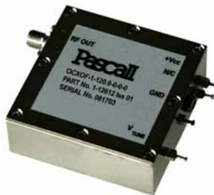
Рис. 1. Сверхмалозумящий термостатированный кварцевый генератор серий ОСХО и ОСХОФ

Относительная нестабильность средней частоты генераторов серии ОСХО составляет \pm 2 \cdot 10^{-7} в интервале температур -30...70°C, уровень старения не превышает 5 \cdot 10^{-7} за месяц, механическая подстройка частоты – \pm 6 \cdot 10^{-6} , электронное управ-